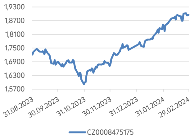
Vývoj hodnoty podílového listu